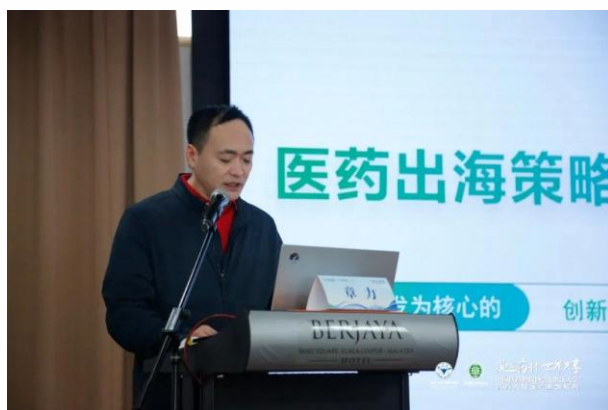
章力作《医药出海策略与实践》主题分享

他表示，中国现有中药资源12800余种，是世界上中草药应用最广泛，药用资源最丰富的国家。对于中药材国际化，他提出，加强标准化与规范化建设；提升中药材产品质量；加强渠道建设，提高中药材推广力度；推动国际化科研创新。同时，作为我国医药产业的重要组成部分，中药材产业搭乘“一带一路”的东风，助力产业发展，加速国际化进程。