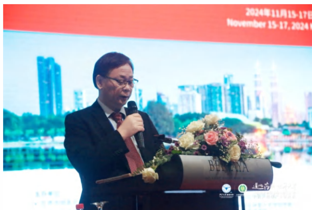
全欧洲中医药学会联合会主席、世界传统医药论坛主席董志林讲话